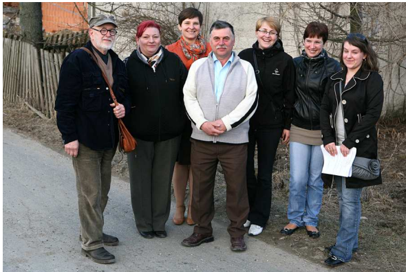
Grupa Odnowy Wsi