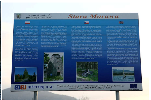
Tablica o miejscowości