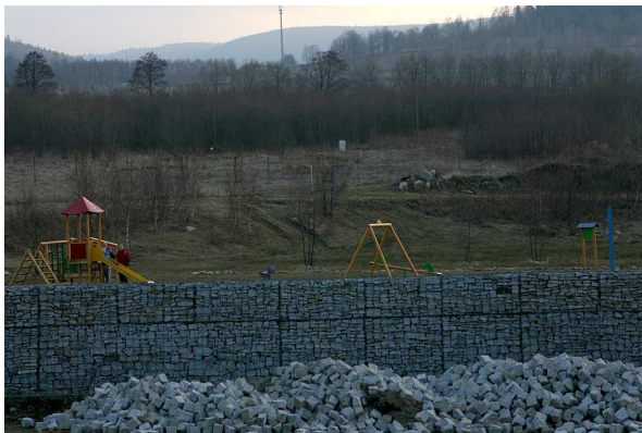
Plac zabaw przy zbiorniku