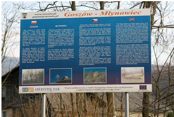
Tablica o miejscowości