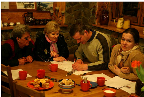
Prace mieszkańców nad strategią