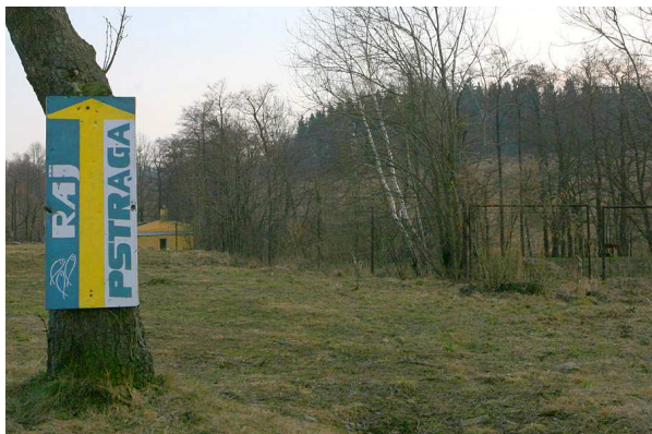
Łowisko komercyjne RAJ PSTRĄGA