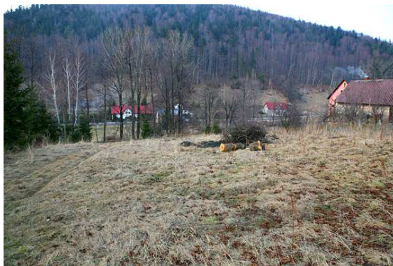
Miejsce pod przyszły plac rekreacyjny