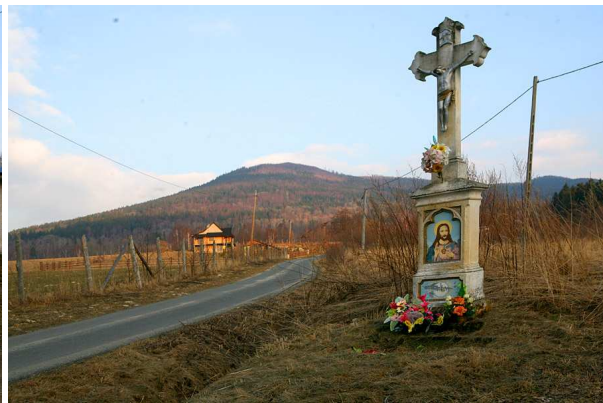
Krzyż przy drodze