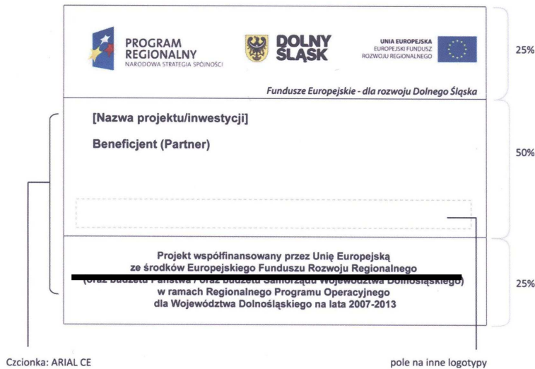
Rys. 19. Wzór tablicy pamiątkowej