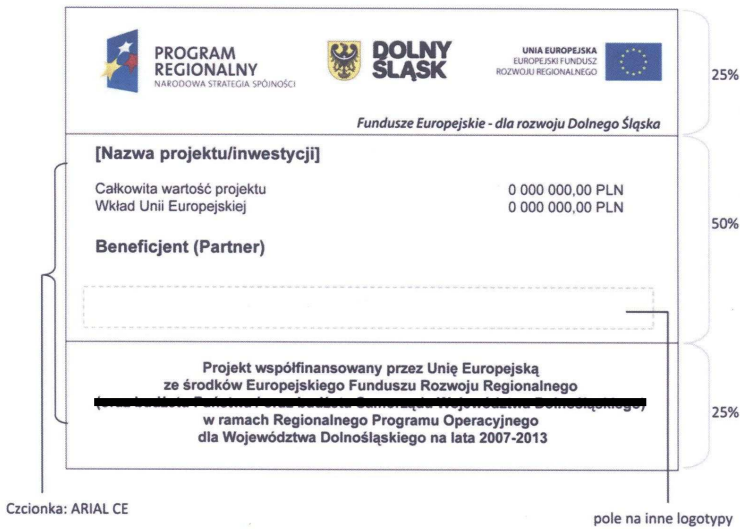
Rys. 18. Wzór tablicy informacyjnej