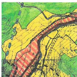
WYRYS ZE STUDIUM UWARUNKOWAŃ I KIERUNKÓW ZAGOSPODAROWANIA PRZESTRZENNEGO MIASTA I GMINY STRONIE ŚLĄSKIE UCHWAŁONEGO UCHWAŁĄ NR IV/17/18 RADY MIEJSKIEJ STRONIA ŚLĄSKIEGO Z DNIA 28 GRUDNIA 2018 ROKU