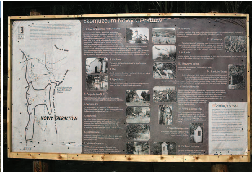
Tablice o miejscowości