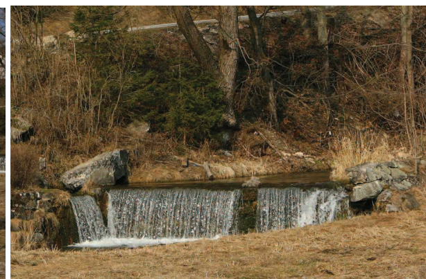
Rzeka Biała Łądecka