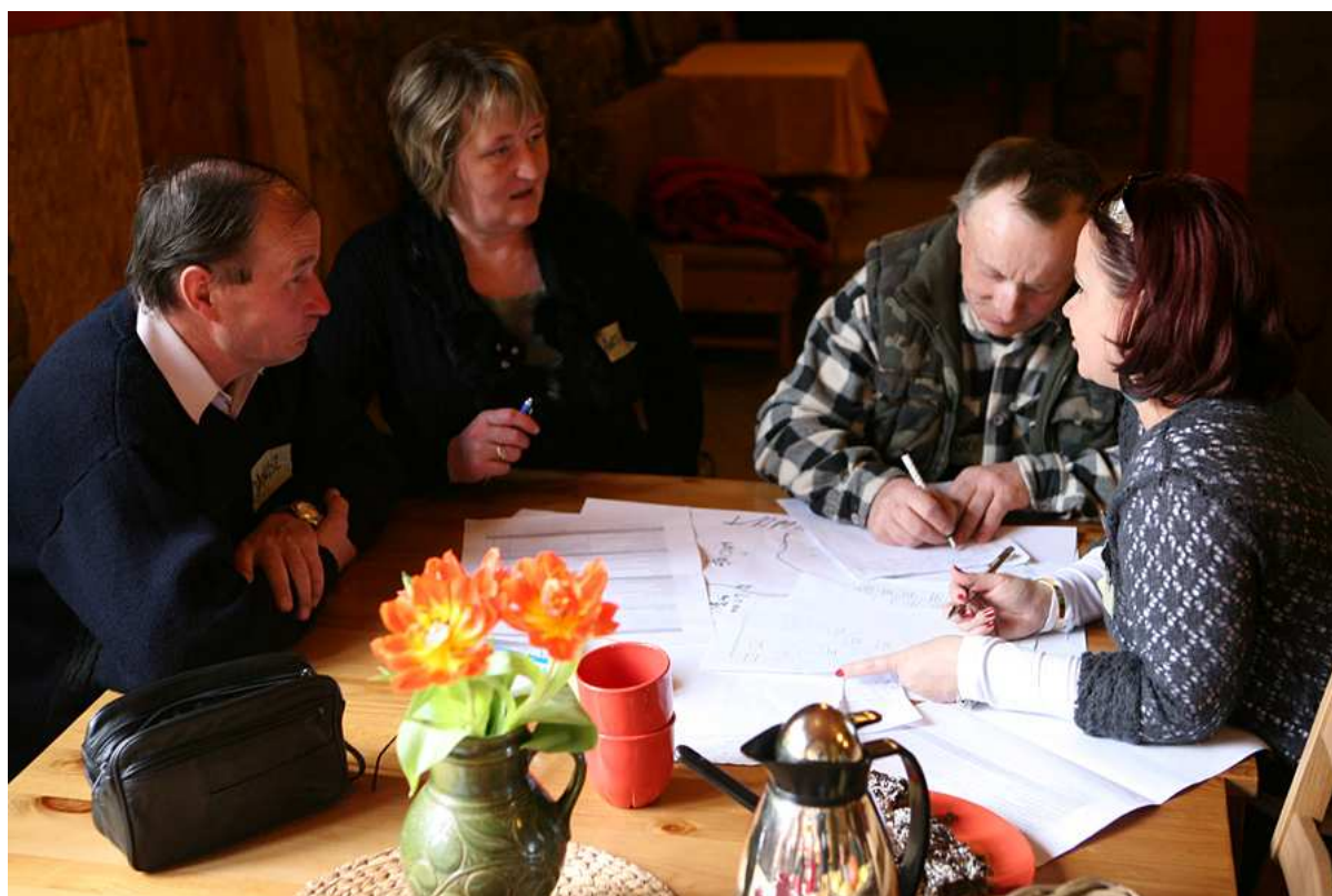
Praca nad strategią