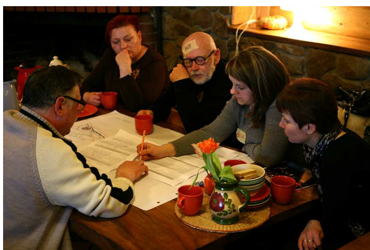
Mieszkańcy podczas prac nad strategią