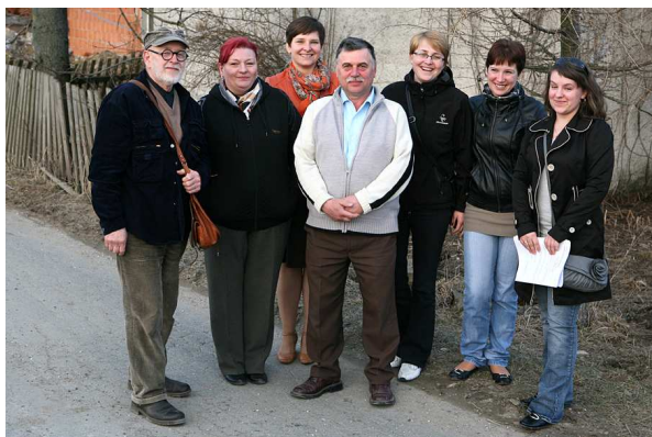
Grupa Odnowy Wsi