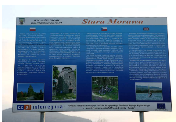
Tablica o miejscowości