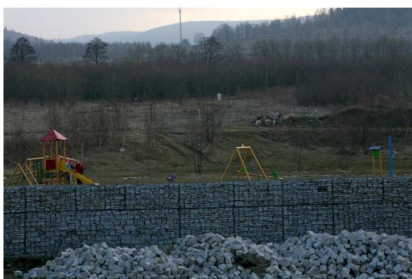
Plac zabaw przy zbiorniku