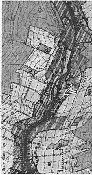
GRANICA PLANU MIEJSCOWEGO

ZA ZGODNOŚĆ ZE STUDIUM UWARUNKOWAŃ I KIERUNKÓW ZAGOSPODAROWANIA PRZESTRZENNEGO MIASTA I GMINY STRONIE ŚLĄSKIE ZATWIERDZONEGO UCHWAŁĄ NR XXVIII/292/13 RADY MIEJSKIEJ STRONIA ŚLĄSKIEGO Z DNIA 28 LISTOPADA 2013 ROKU /jednolity dokument studium/