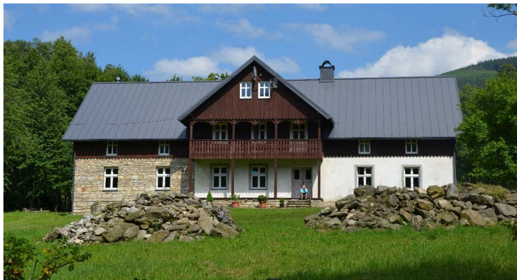
Stara zabudowa wsi. Fot. Anna Szczepanek.