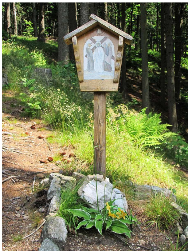
Jedna ze stacji kalwarii na Suszycy.