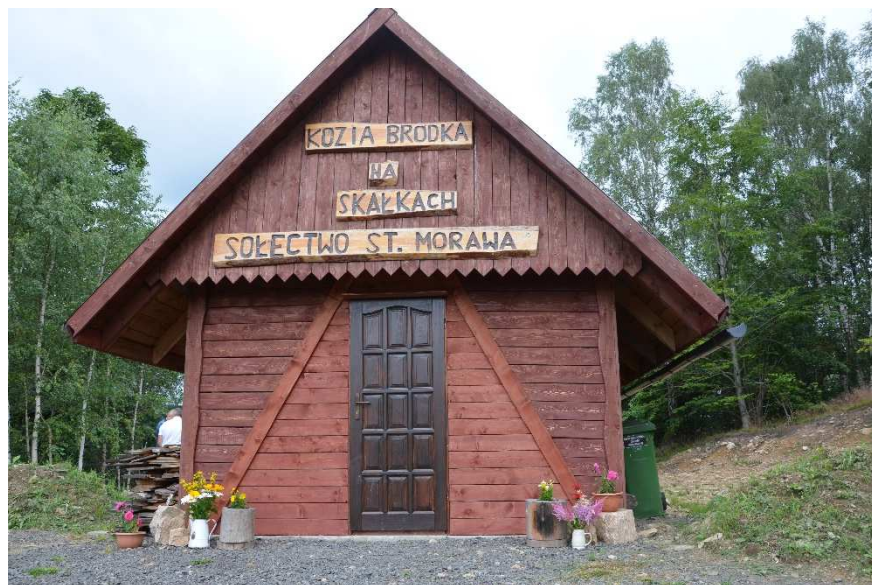
Chata sołecka „Kozia Bródka na Skalkach”.