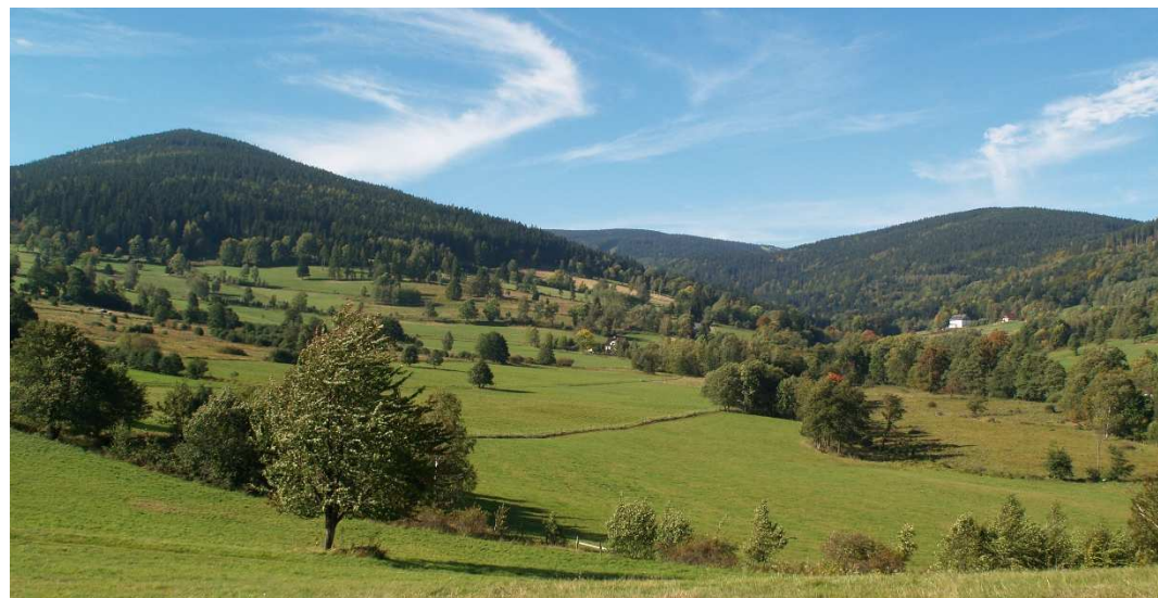
Widok spod „Koziej Bródki na Skałkach”. Na pierwszym planie góra Młyńsko.