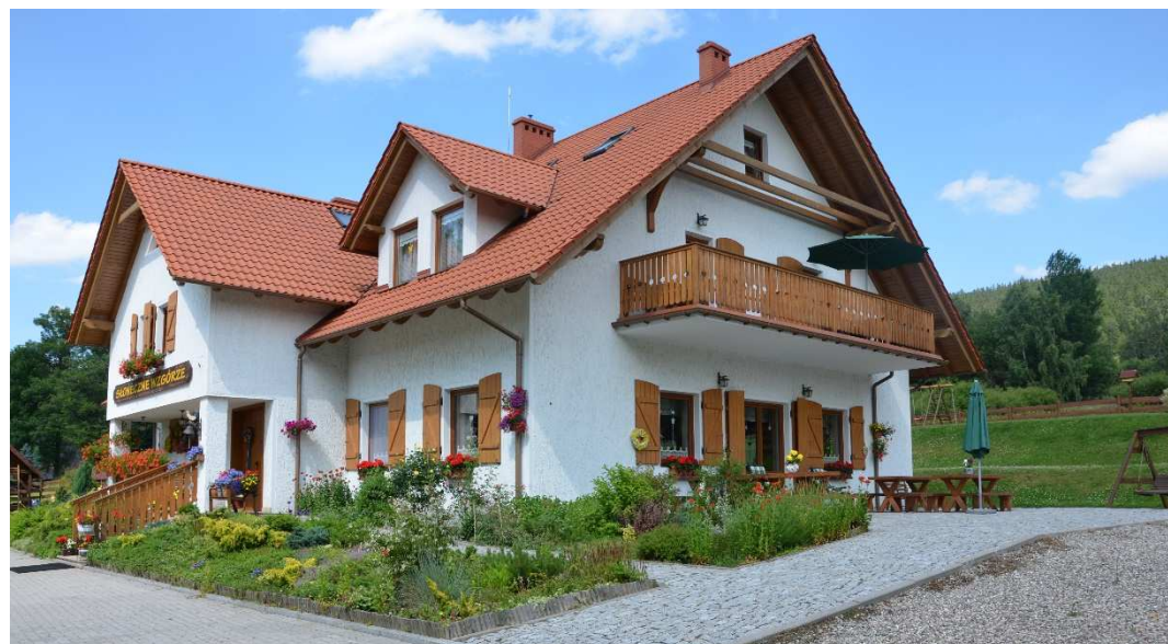
Pensjonatowa zabudowa wsi.