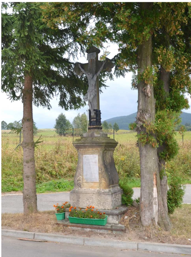
Przydrożny krzyż.