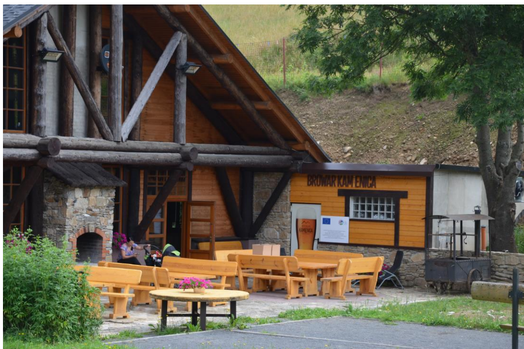
Karczma Browar Kamienica.