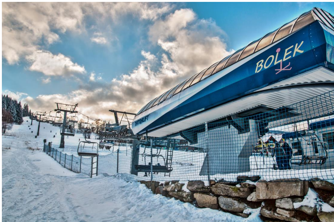
Dolna stacja kolei krzesełkowej Stacji Narciarskiej Kamienica (stacja znajduje się pomiędzy wsią Kamienica i Bolesławów).