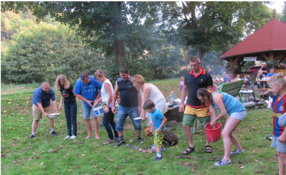
„Święto pieczonego ziemniaka” na działce sołeckiej. W tle wiata sołecka.