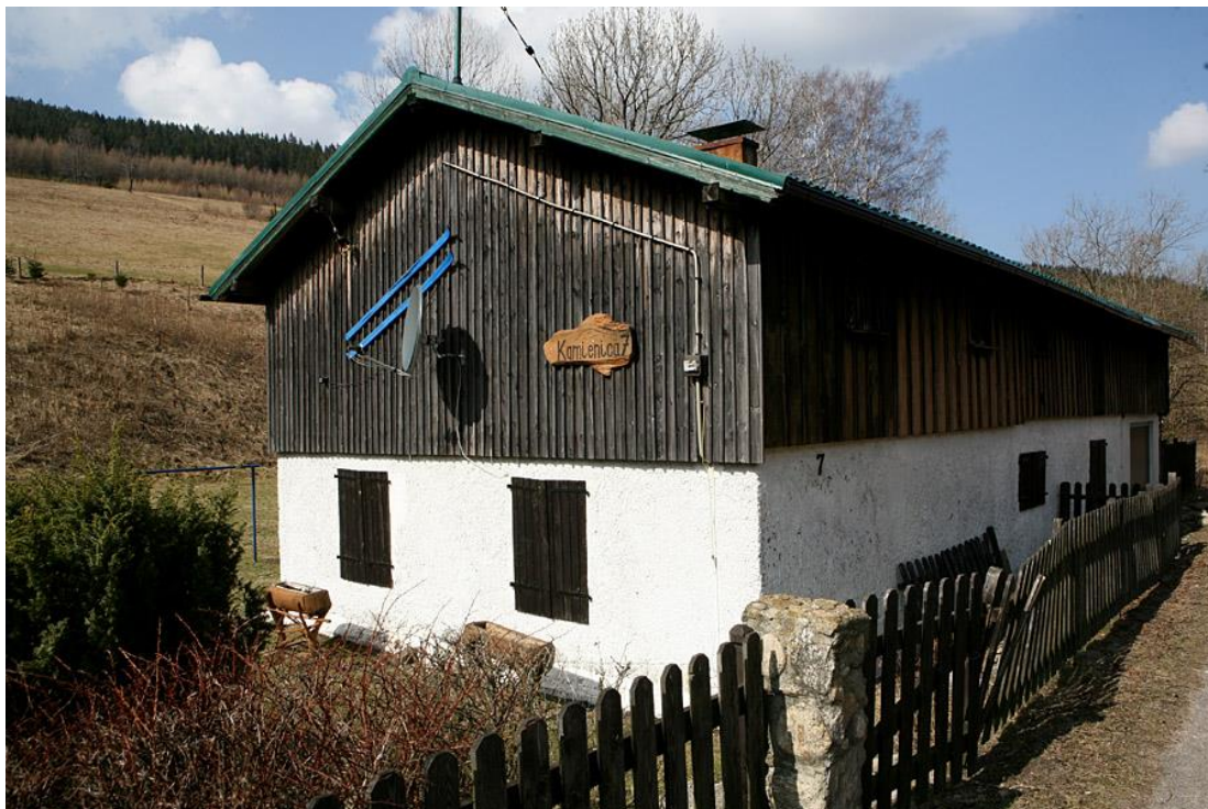
Stara zabudowa we wsi Kamienica.