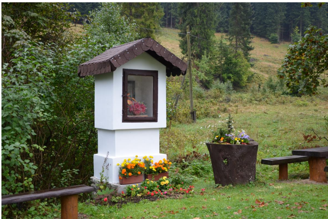
Krzyż i kapliczka we wsi Kamienica.