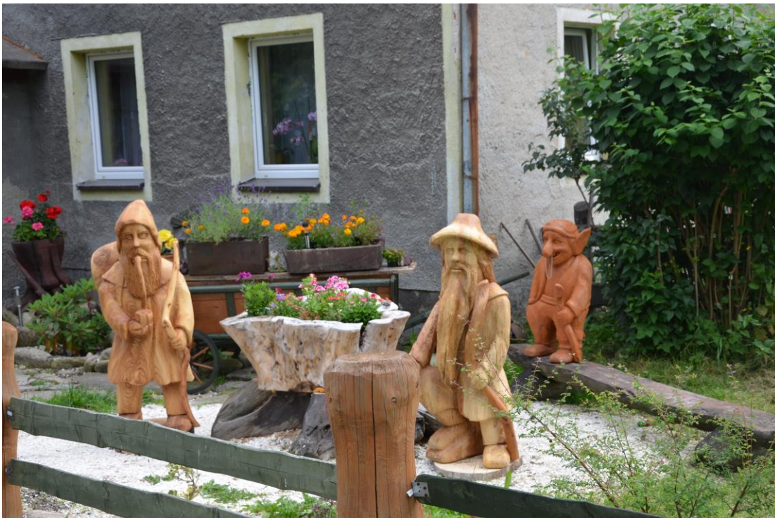
Przed warsztatem rzeźbiarstwa artystycznego, Kamienica 10.