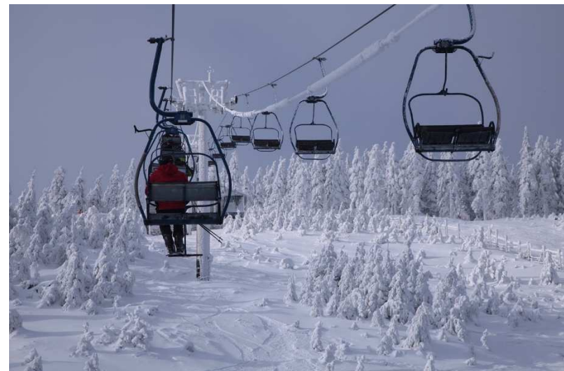
Ośrodek narciarski „Czarna Góra” w Siennej.