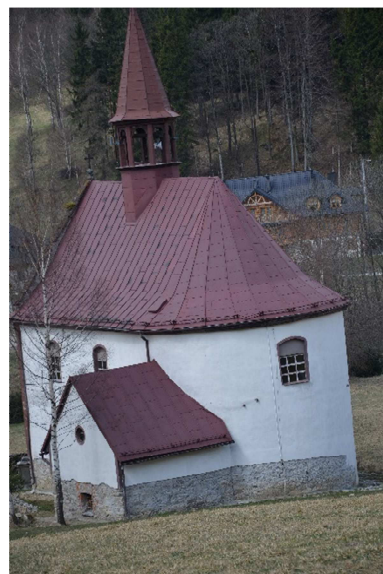
Kościół w Siennej.