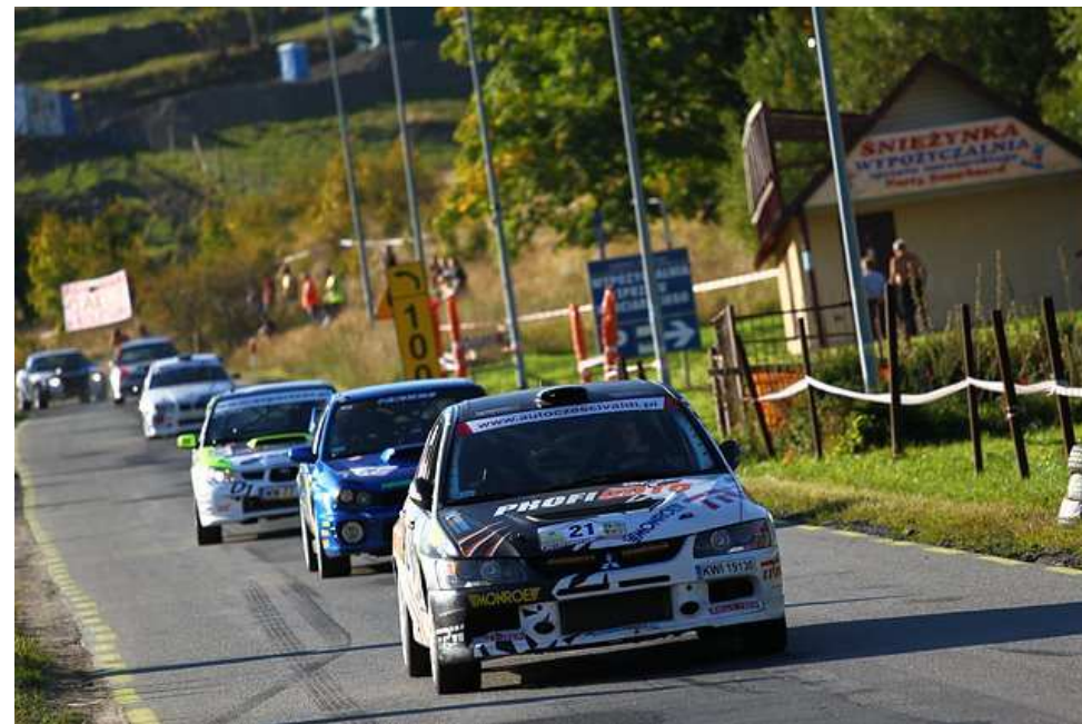
Górskie Samochodowe Mistrzostwa Polski w Siennej.