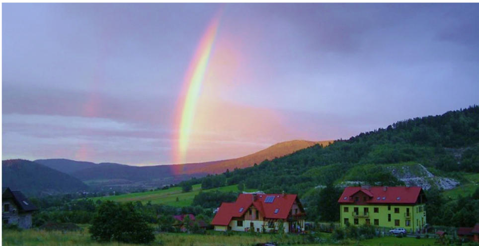
Obiekty noclegowe w Stroniu Śląskim wsi.