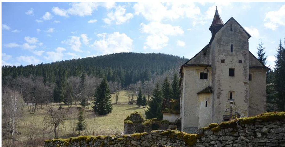
Kościół w Janowej Górze.