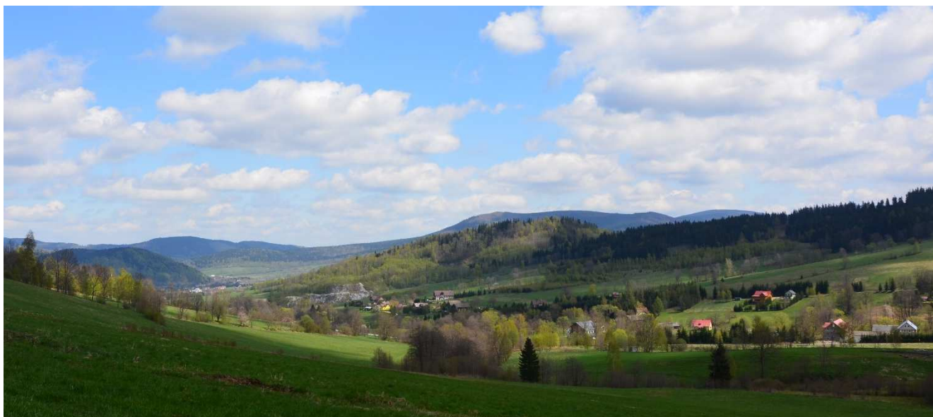
Fot. Widok na Stronie Śląskie wieś.

Sołectwo Stronie Wieś – urokliwa góraska okolica, z rozwiniętą bazą sportowo - turystyczną, zapewniającą doskonały wypoczynek i rekreację.