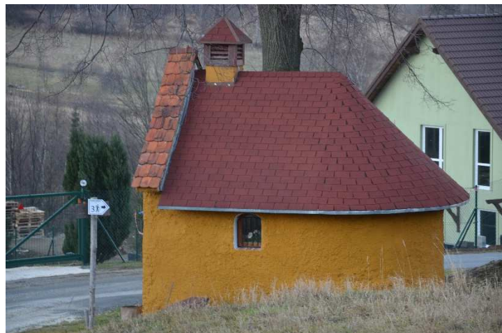
Kapliczka w Stroniu Śląskim wsi.