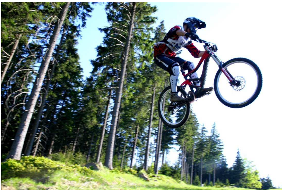
Zawody downhill w Siennej.