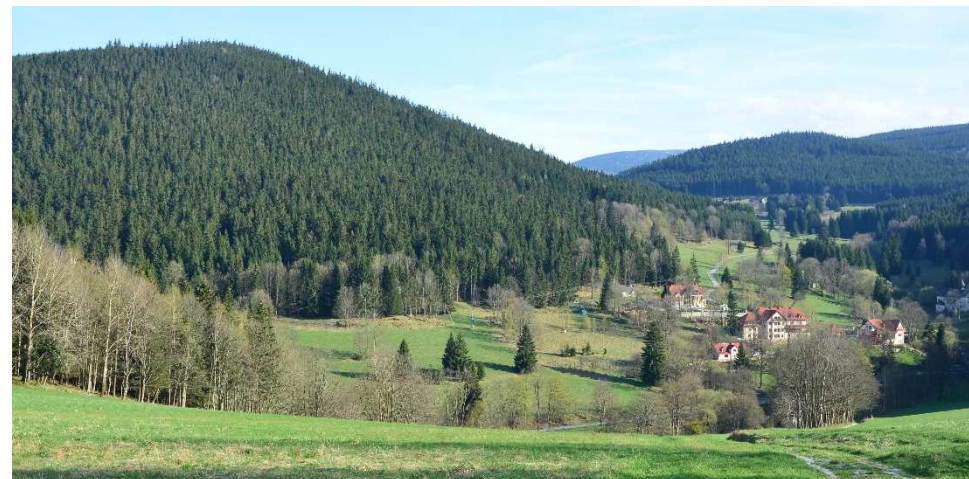
Widok na górę Rudka i wieś Janowa Góra.