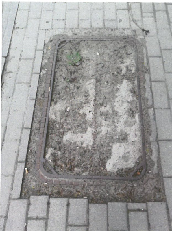
Pokrywa studzienki przy ul. Kościuszki 48.